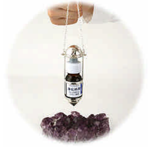
エネルギーペネトレーションペンダント

この「プロ養成講座」では、「基礎講座」で行なった各技法、ヒーリング、エクササイズ、瞑想が、セラピストとしてエネルギーワークをしていく上で不可欠な、エネルギーレベルでの調整と、基本的な下準備であった事が明らかになるでしょう。