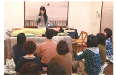
デモンストレーション風景