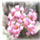
季節の折々に咲く庭のお花