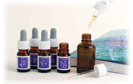
マウントフジフラワーエッセンス

*「基礎講座」修了者のみが参加出来ます。以前の集中または東京夜間の基礎講座修了者の参加も可能です。