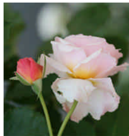
季節の折々に咲くお庭の花