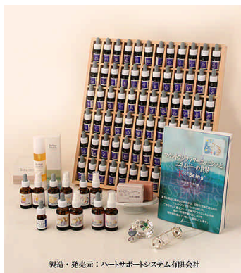
製造・発売元:ハートサポートシステム有限会社 マウントフジフラワーエッセンス